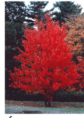
Érable à sucre

Du mardi 19 au vendredi 22 mai 2015 se tiendra une distribution de jeunes plants d'arbres à la population entre 13h30 et 16h00 au bureau municipal. Des feuillus et des résineux seront disponibles. Les quantités sont toutefois limitées à trois plants par personne.